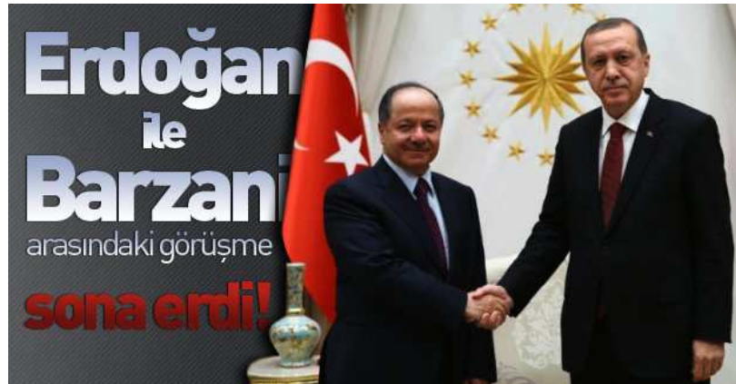
اردوغان و مسعود بارزانی - شرکای استراتژیک در منطقه

معنی گُره خَر است. متأسفانه در دو دهه گذشته احزاب کردی ایران به نوعی مستقیم و غیرمستقیم به جیره خوار همین حزب و رقیب آن اتحادیه میهنی تبدیل شده‌اند. حزب دموکرات کردستان عراق در عمل خود را به ترکیه و اتحادیه میهنی کردستان عراق خود را به ایران فروخته‌اند. بنا به گزارشات متعدد از منابع مختلف، جمهوری اسلامی ایران فقط در شهر سلیمانیه بیش از ۵۰۰ خانه امن در اختیار دارد. در طی سال های گذشته صدها نفر از اعضای احزاب کرد ایرانی در کردستان عراق به کمک همین احزاب ترور شده‌اند. امروز تقریباً همه احزاب کردی در چهارپارچه کردستان سرنوشت و آینده سیاسی خود را به یکی از قطب های جهانی سرمایه و سرمایه های منطقه‌ای و محلی گره زده‌اند.)