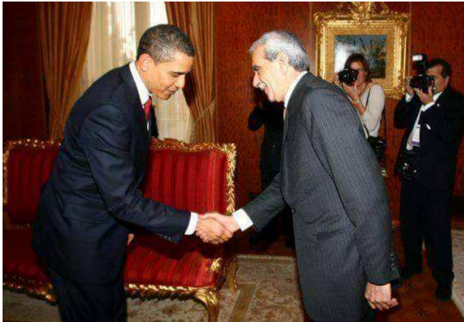
ملاقات احمد ترک با اوباما- هفتم آوریل ۲۰۰۹

"یک سیستم بورژوا دموکراتیک که کنفدراسیون دموکراتیک نامیده میشود" (ظافر انات) ۴. دموکراسی کافی ترین (کامل ترین) شکل سیاسی است که مردم اجتماعا تقسیم شده را متحد میسازد.